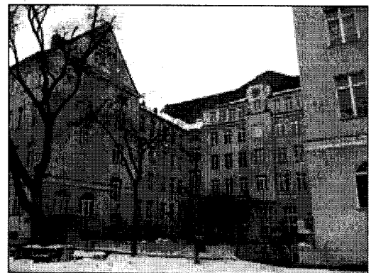
2006年3月、教師が学校閉鎖を求めたベルリン・ノイケルン区のリュトリ基幹学校。ドイツの外国人参政権問題の核心があった

「教育をまともに受けていないイスラム系移民の割合が多すぎる。教育を経てからでなければ、参政権の付与は認められない」